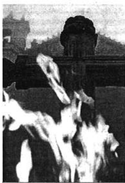
Imagen de 'Fuego en Castilla'.

En 1928 anticipó ya varias de sus técnicas más características, incluyendo el 'desbordamiento panorámico de la imagen fuera de los límites de la pantalla y el concepto de visión táctil. Dichas técnicas, y las del sonido diafónico y otras exploraciones en el campo sonoro, quedan evidenciadas en ese Tríptico Elemental de España , iniciado en 1952 y sólo concluido póstumamente.